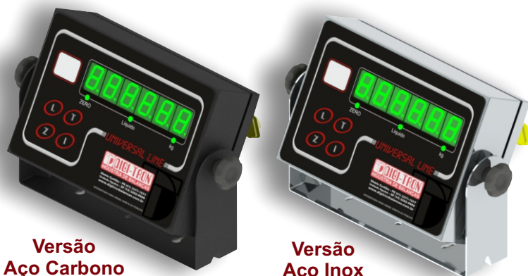
Versão Aço Carbono