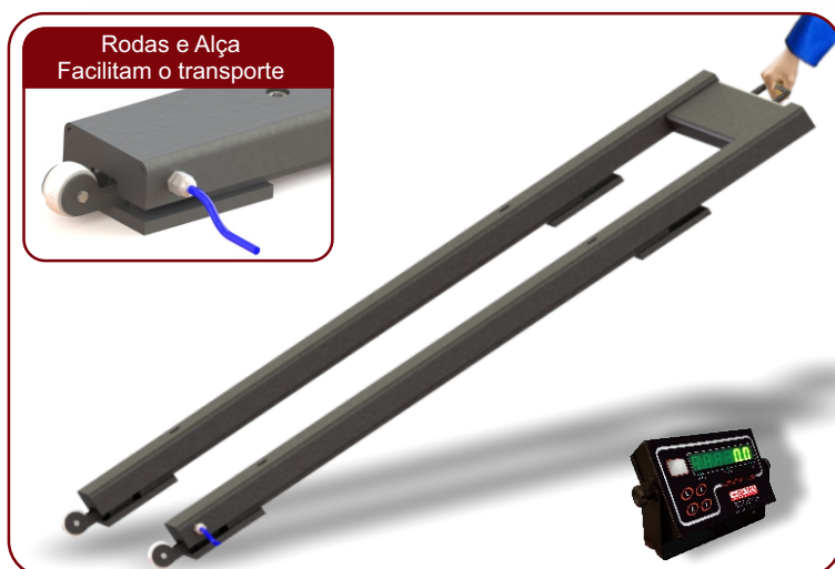
Rodas e Alça Facilitam o transporte