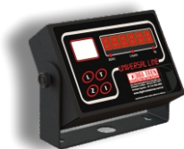
Versão Aço Carbono