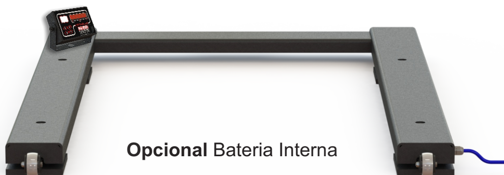
Opcional Bateria Interna