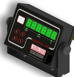
Versão Aço Carbono